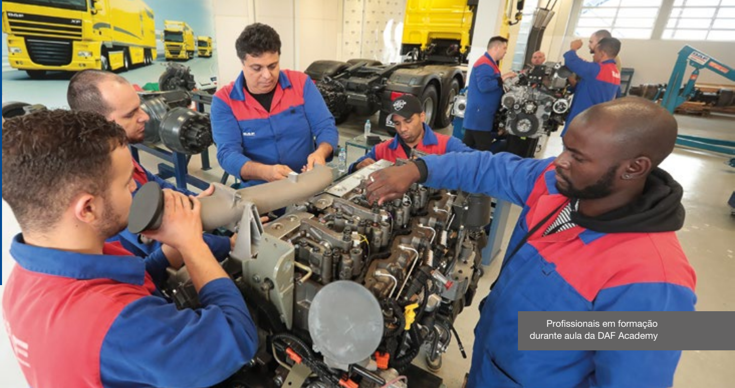
Profissionais em formação durante aula da DAF Academy