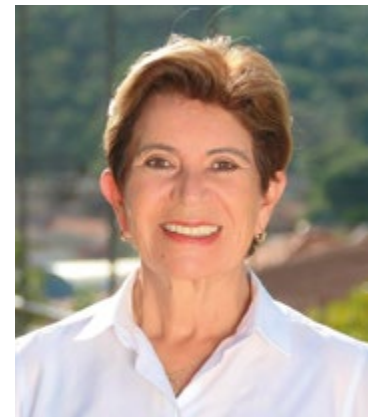
Elizabeth Schmidt, Prefeita de Ponta Grossa

Elizabeth Schmidt - O município espera que a DAF cresça e brilhe cada vez mais. A expectativa é de expansão das operações da empresa, construção de novas instalações, aumento da capacidade de produção ou diversificação de produtos. A Prefeitura esteve e permanece como interessada no crescimento contínuo e constante da DAF.