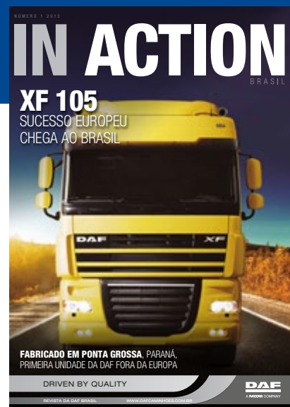
Capa da primeira DAF In Action publicada no Brasil em 2013

Em 2013, circulou a primeira edição da DAF In Action no Brasil, que tem como base o projeto global similar da matriz da DAF e evoluiu o modelo editorial com o tempo. Ao longo desses dez anos, a revista tem cumprido o papel de informar o público sobre os principais movimentos da DAF Caminhões no país, além de ser um importante instrumento de relacionamento e proximidade com clientes. A cada número, a publicação conta por meio de matérias e imagens a história da DAF, por exemplo, a primeira capa trazia o XF 105, o primeiro fabricado no Brasil. Conforme a empresa aprimora o portfólio, as páginas e notícias acompanham os avanços.